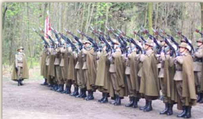
Foto-migawki 150 rocznica śmierci płk. Francesco Nullo, Polana Nullo w Krzykawce, 5 maja 2013 r.