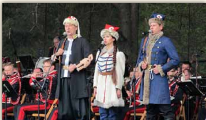
Foto-migawki 150 rocznica śmierci płk. Francesco Nullo, Polana Nullo w Krzykawce, 5 maja 2013 r.