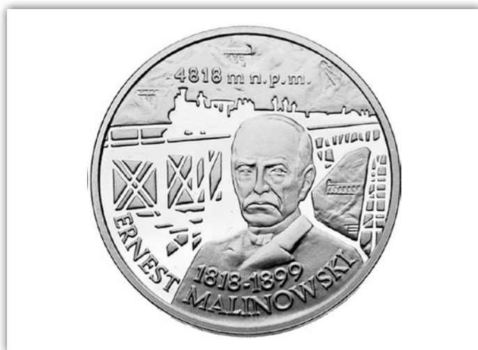
Srebrna moneta wydana z okazji 100-lecia śmierci Ernesta Malinowskiego

Za życia Malinowskiego kolej dotarła do miejscowości Oroya oraz Cerro de Pasco w Andach. Opinia światowa uznała to przedsięwzięcie za cud techniki inżynierskiej. Realizując je, Malinowski wprowadził wiele całkowicie nowatorskich rozwiązań w zakresie technologii budowy mostów i tuneli. Cała trasa liczy 346 km, zbudowano na niej ponad 30 mostów i wiaduktów (jedną z największych konstrukcji na świecie jest