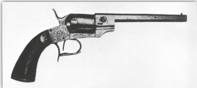
Fot. 1. Rewolwer pułkownika Nullo