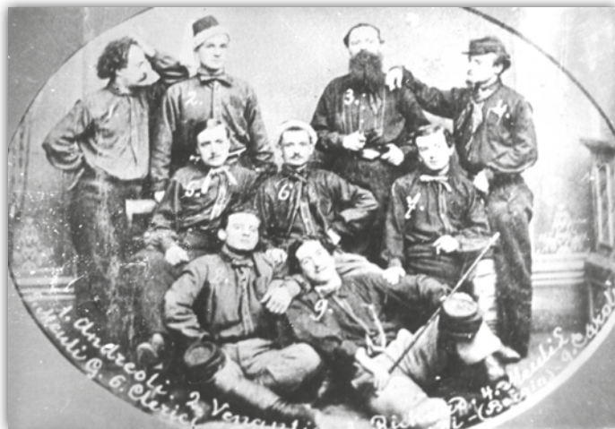
Fot. 2. Powstańcy legii spod Krzykawki