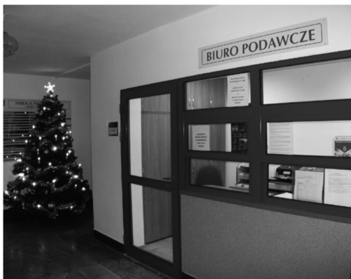
Biuro Podawcze Urzędu Gminy Bolesław, nr telefonu (32) 6424501, (32) 6424071 wew. 225

Formularz wniosku o konto na platformie eUrząd oraz Informacje na temat procedury uzyskania nazwy użytkownika i hasła dostępne są na głównej stronie systemu https://eurzad.gminaboleslaw.pl/eurzad lub przez bezpośredni kontakt z pracownikami Urzędu.