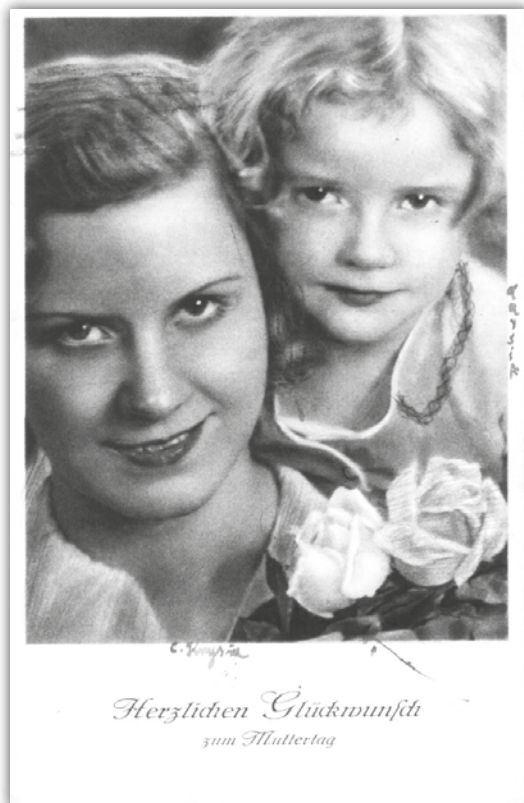
Ryc. 2 Niemiecka kartka pocztowa wydana z okazji Dnia Matki. Rok 1940.

Pozyskiwanie pocztówek do Naszej kolekcji jest możliwe na wiele sposobów. Można je kupować w sklepach, antykwariatach, aukcjach internetowych lub wymieniać się z kolegami bądź za pośrednictwem Internetu.