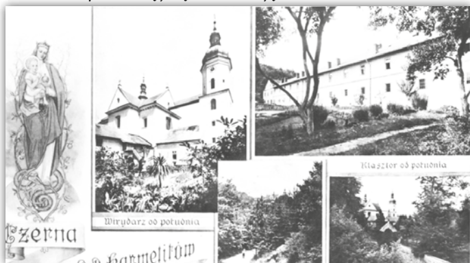
Ryc. 3 Pocztówka z Czernej. Rok wydania – około 1940.

Opowiadać o pocztówkach można w nieskończoność, gdyż każda z osobna zawiera jakąś bogatą historię. Niektóre pokazują miejsca, budynki, ludzi których już nie ma, a inne są interesujące ze względu na wartość sentymentalną jaką dla Nas mają.