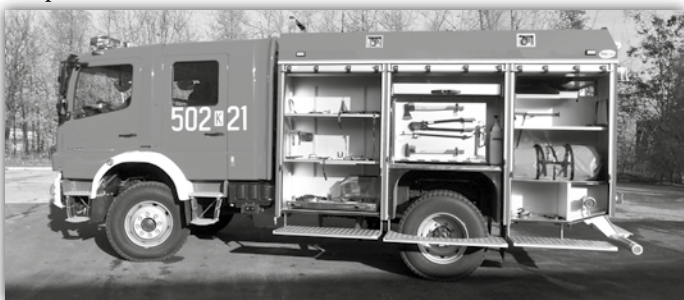
► Tekst: st. kpt. Tomasz Mucha

Wprowadzenie samochodu do podziału bojowego nastąpi po 20 listopada.