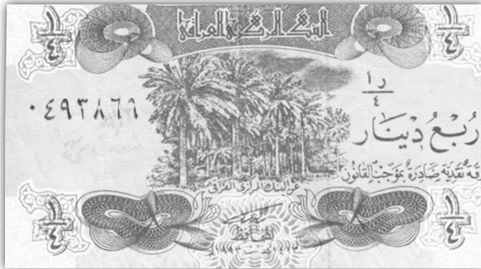
Ryc. 1 1/4 dinara irackiego z czasów rządów Saddama Husajna.

Nazwa bank wywodzi się od włoskiego słowa banco, oznaczającego w średniowiecznych miastach północnej Italii stół lub ławę, na której dokonywano wymiany pieniędzy. Jednym słowem był to starodawny kantor wymiany. Wymiana pieniędzy to najstarsza forma operacji bankowych, znana już w starożytności. Dopiero w początkach kapitalizmu zaczęły się wykształcać banki, będące pierwowzorem współczesnych przedsiębiorstw, dokonujących ogromnych i skomplikowanych operacji pieniężnych. Banki gromadziły kapitały pieniężne i obracały nimi już w XVII w., a w XVIII stuleciu zaczęły w niektórych krajach, zwłaszcza w Anglii i Francji, wywierać coraz większy wpływ na życie gospodarcze i polityczne.