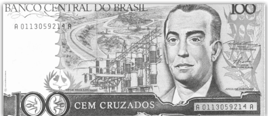
Ryc. 3 Archiwalna waluta Brazyli – 100 cruzados wydana przez Centralny Bank Brazylii.