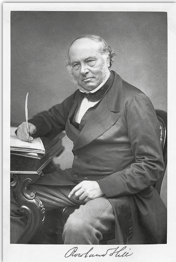
Ryc. 1 Rowland Hill (1795-1879).

Sir Rowland Hill (1795-1879) był wiejskim nauczycielem, wychowawcą i nowatorem w pedagogice, a później wysokim urzędnikiem brytyjskiej poczty oraz człowiekiem ogarniętym pasją wynalazczości.