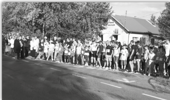
Foto-migawki z biegu na str.11-12

Bieg został zorganizowany przez Centrum Kultury im. Marii Płonowskiej w Bolesławiu, Samorządowy Zespół Oświaty i Wychowania w Bolesławiu oraz Sołtysa i Radę Sołecką Hutek