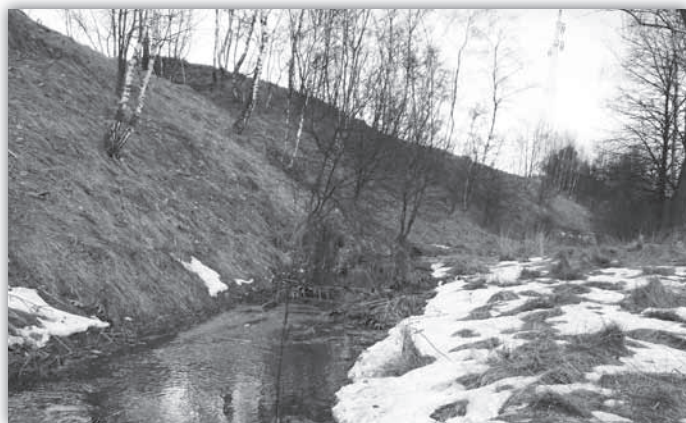
Środkowy bieg Strugi