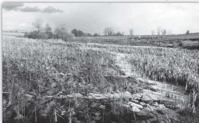
Górny bieg Strugi