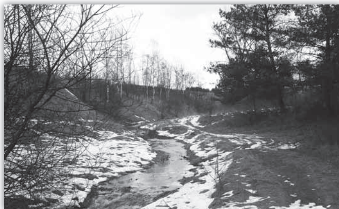
Dolny bieg Strugi