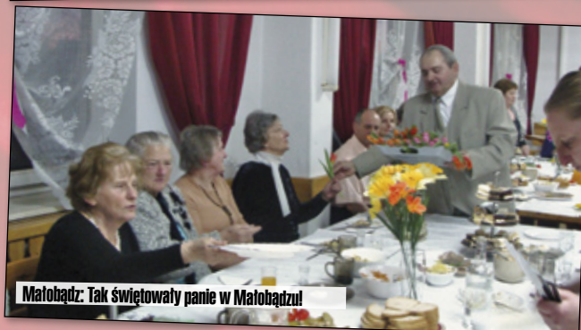
Małobądz: Tak świętowały panie w Małobądzu!