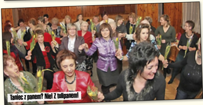
Taniec z panem? Nie! Z tulipanem!