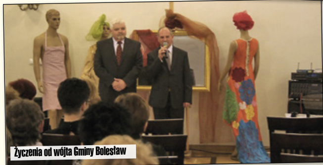
Życzenia od wójta Gminy Bolesław