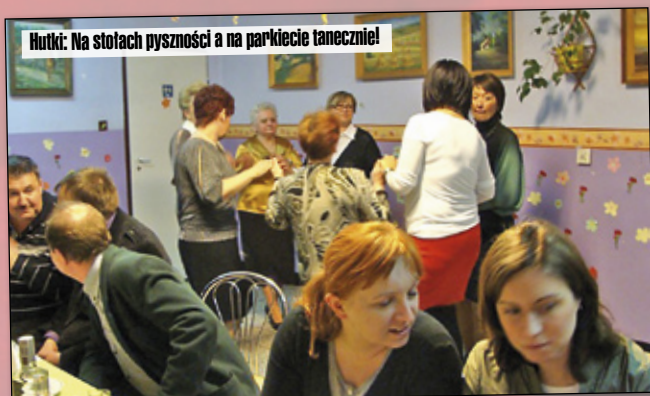
Hutki: Na stołach pyszności a na parkiecie tanecznie!