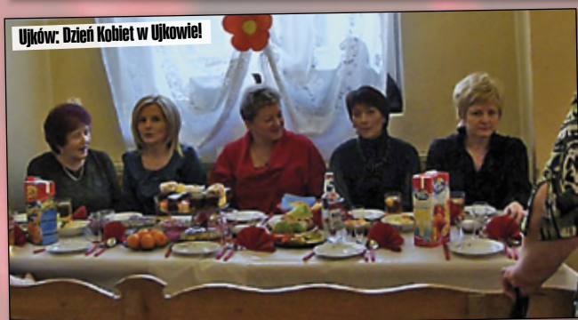
Ujków: Dzień Kobiet w Ujkowie!