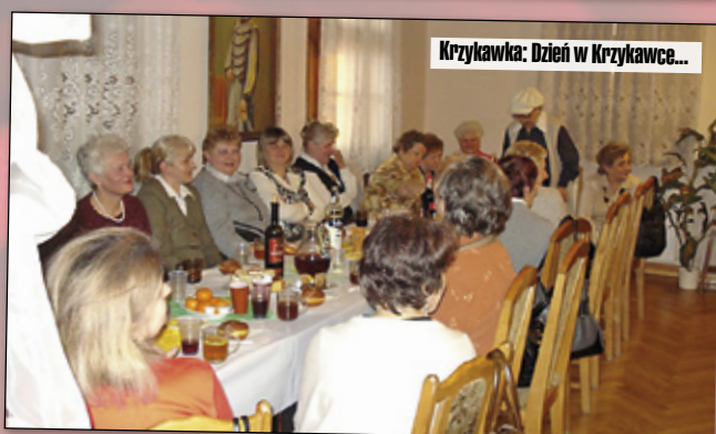
Krzykawka: Dzień w Krzykawce...