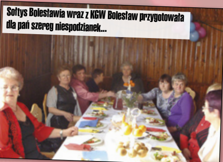
Sołtys Bolesław wraz z KGW Bolesław przygotowała dla pań szereg niespodzianek...