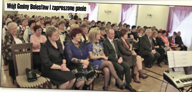
Wójt Gminy Bolesław i zaproszone panie