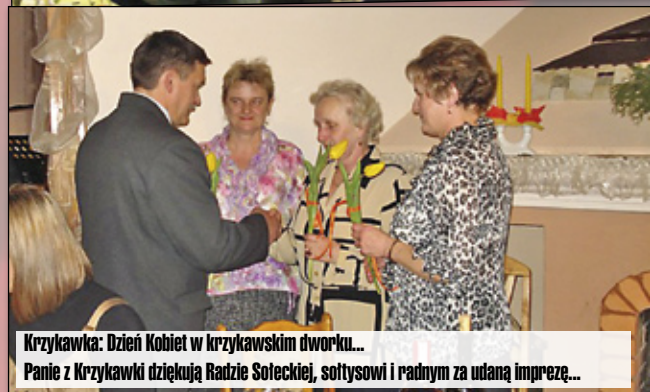
Krzykawka: Dzień Kobiet w krzykawskim dworku... Panie z Krzykawki dziękują Radzie Sołeckiej, sołtysowi i radnym za udaną imprezę...