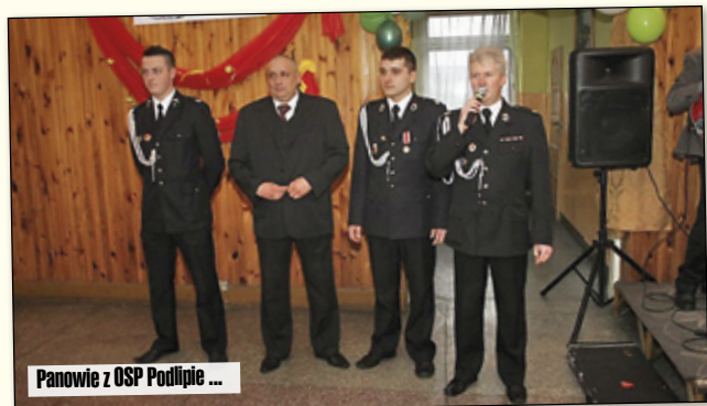
Panowie z OSP Podlipie ...