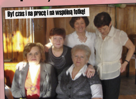
Był czas i na pracę i na wspólną fotkę!