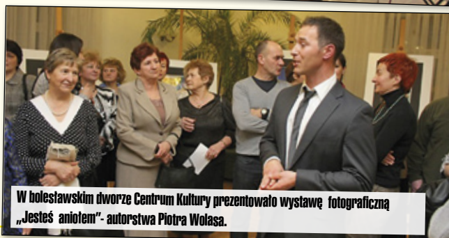
W bolesławskim dworze Centrum Kultury prezentowało wystawę fotograficzną „Jesteś aniołem”- autorstwa Piotra Wołasa.