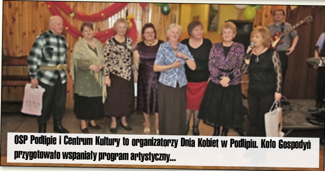
OSP Podlipie i Centrum Kultury to organizatorzy Dnia Kobiet w Podlipiu. Kolo Gospodyń przygotowało wspaniały program artystyczny...