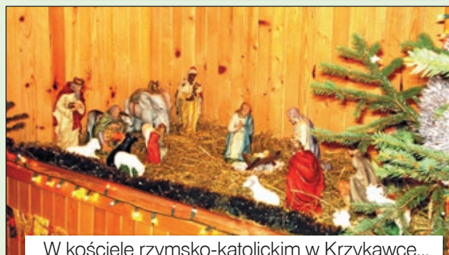
W kościele rzymsko-katolickim w Krzykawce...