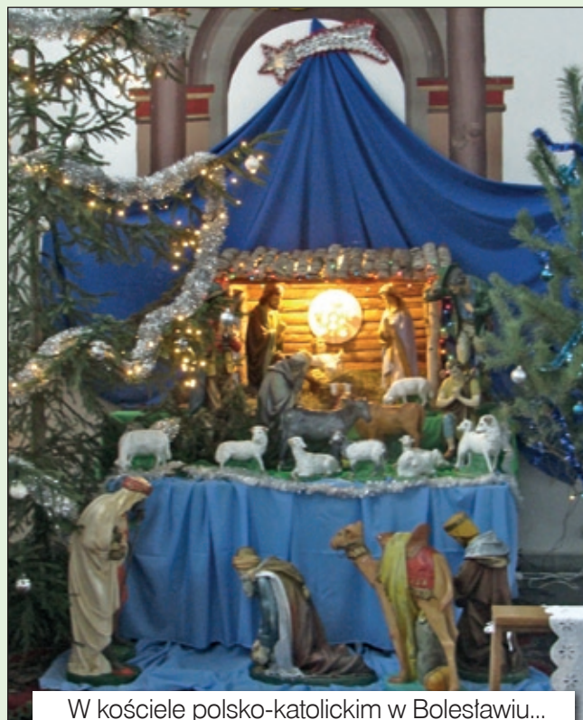
W kościele polsko-katolickim w Bolesławiu...