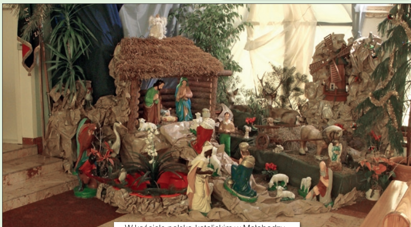
W kościele polsko-katolickim w Matobądzu...