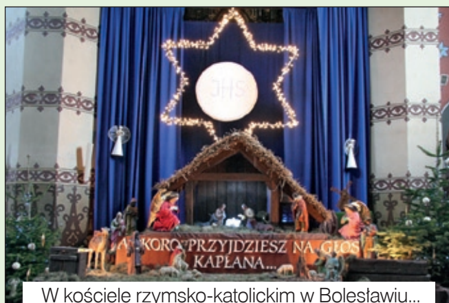
W kościele rzymsko-katolickim w Bolesławiu...