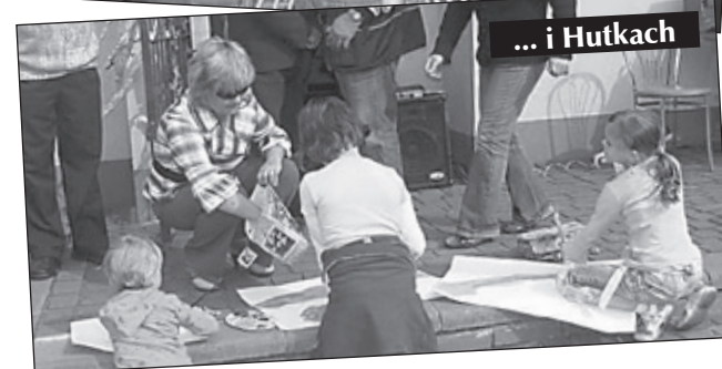
... i Hutkach