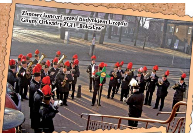
Zimowy koncert przed budynkiem Urzędu Gminy Orkiestra ZGH „Bolesław”