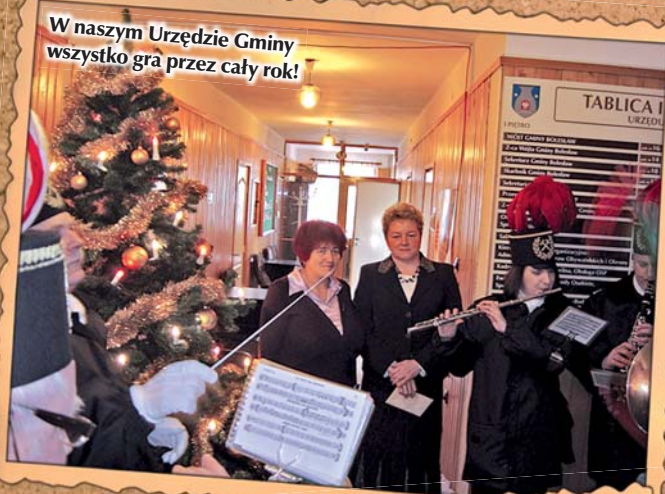
W naszym Urzędzie Gminy wszystko gra przez cały rok!