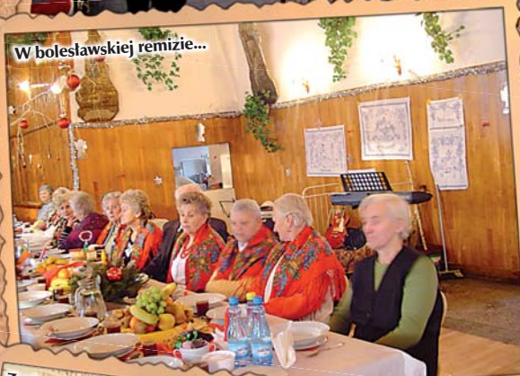
W bolesławskiej remizie...