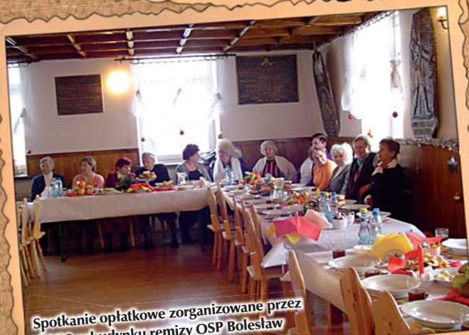
Spotkanie opłatkowe zorganizowane przez GOPS w budynku remizy OSP Bolesław