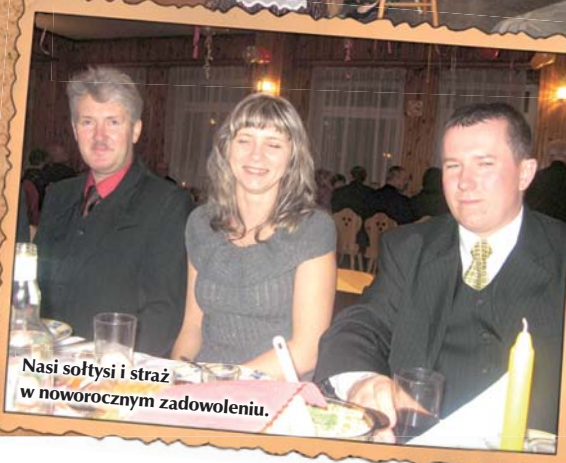
Nasi sołtysi i straż w noworocznym zadowoleniu.