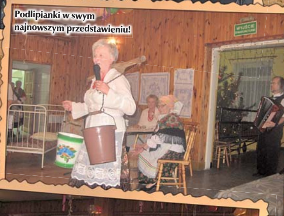
Podlipianki w swym najnowszym przedstawieniu!