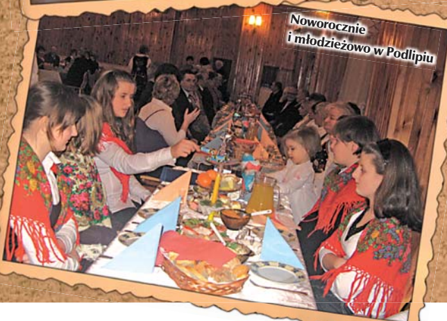
Noworocznie i młodzieżowo w Podlipiu