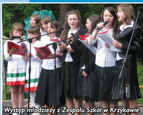
Występ młodzieży z Zespołu Szkół w Krzykawie