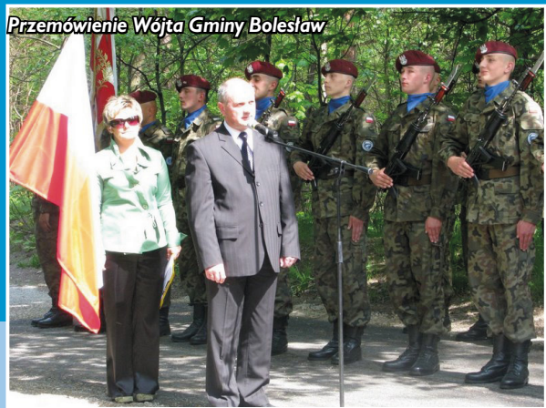
Przemówienie Wójta Gminy Bolesław