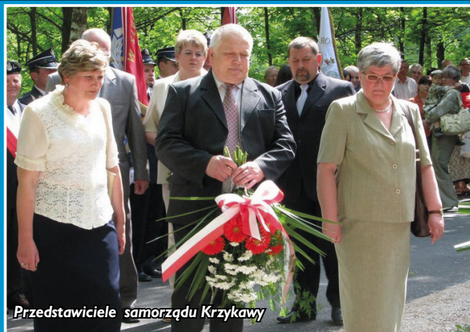
Przedstawiciele samorządu Krzykawki