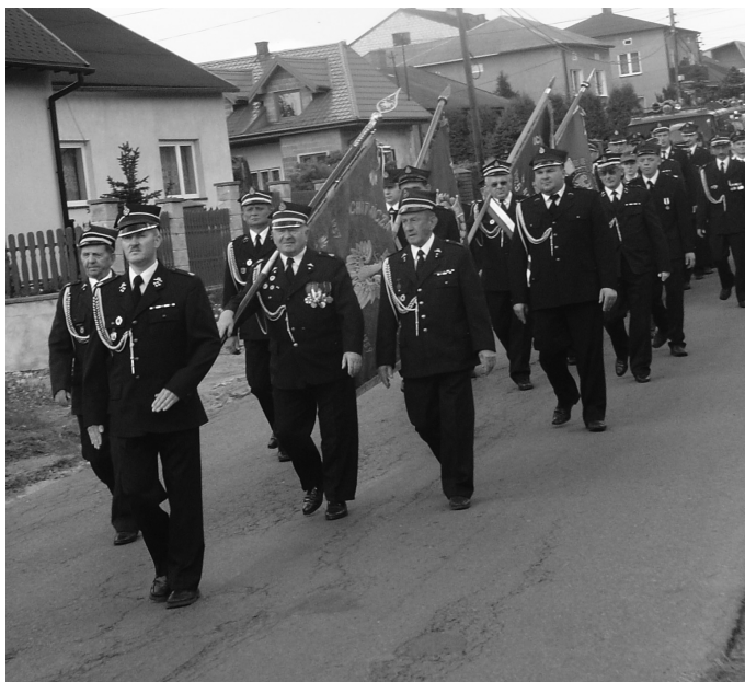
Uroczysty przemarsz strażaków...

Są nazywani strażnikami żywiołów lub rycerzami Świętego Floriana. Mowa o strażakach, którzy corocznie 4 maja obchodzą swoje święto.