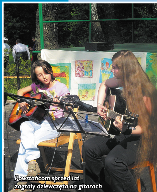
Powstańcom sprzed lat zagrały dziewczęta na gitarach