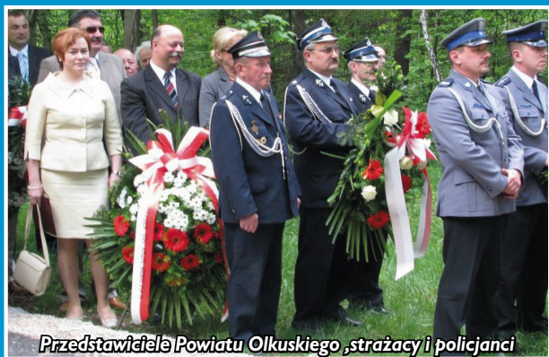
Przedstawiciele Powiatu Olkuskiego, strażacy i policjanci