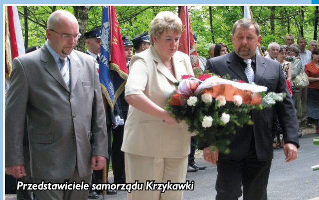
Przedstawiciele samorządu Krzykawki