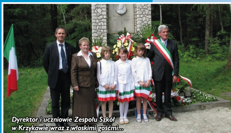
Dyrektor i uczniowie Zespołu Szkół w Krzykawie wraz z włoskimi gośćmi...