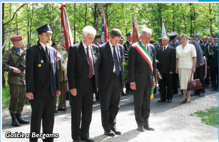
Goście z Bergamo