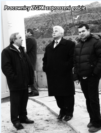
Pracownicy ZGKi zaproszeni goście