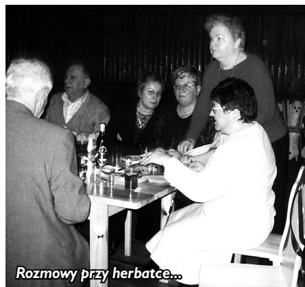
Rozmowy przy herbatce...

Aby umożliwić te kontakty, zorganizowaliśmy w okresie karnawału spotkanie, które odbyło się 11 stycznia w budynku remizy OSP Bolesław.