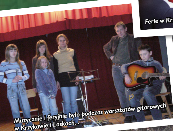
Muzycznie i feryjnie było podczas warsztatów gitarowych w Krzykawie i Laskach...