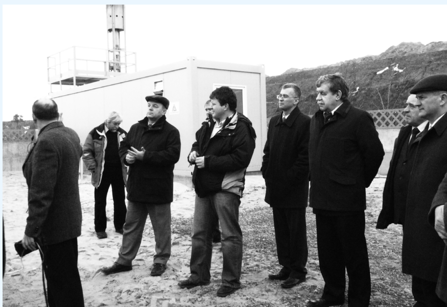
Przedstawiciele władz gminy, dyrekcja ZGK w Bolesławiu oraz wykonawcy projektu odgazowywania