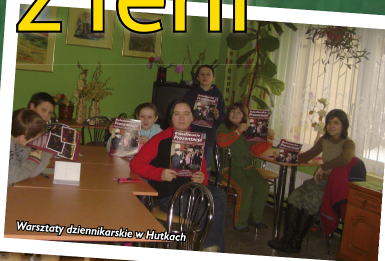
Warsztaty dziennikarskie w Hutkach