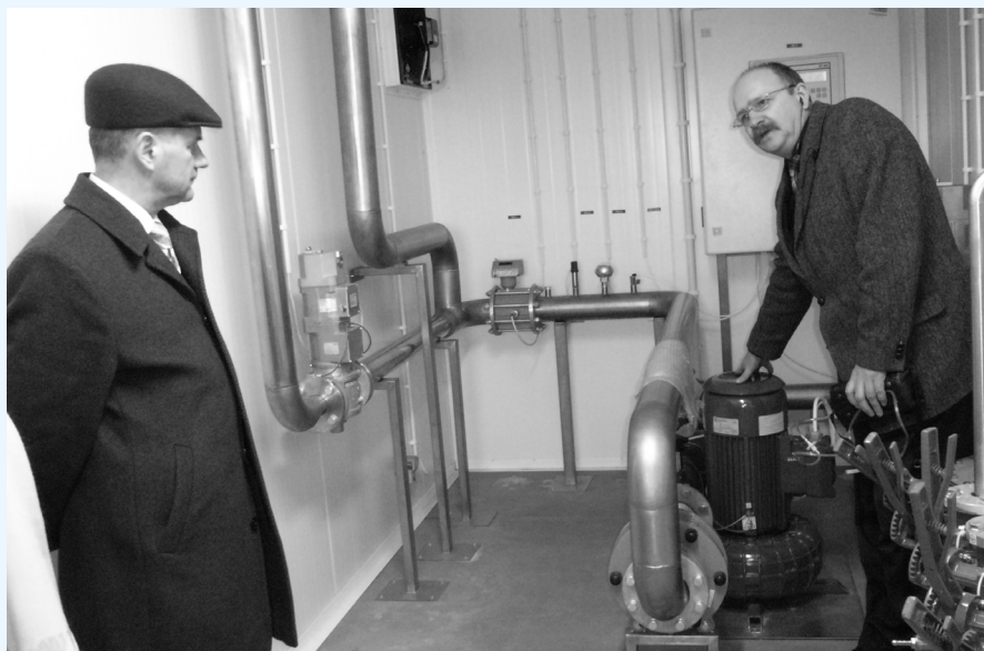
Wójt Gminy Bolesław zapoznaje się ze szczegółami technologii