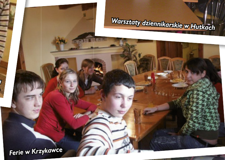
Ferie w Krzykawce