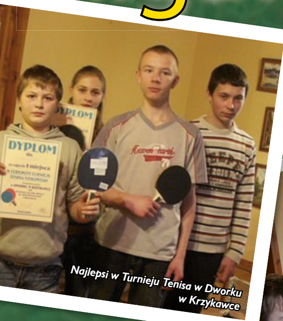
Najlepsi w Turnieju Tenisa w Dworcu w Krzykawce