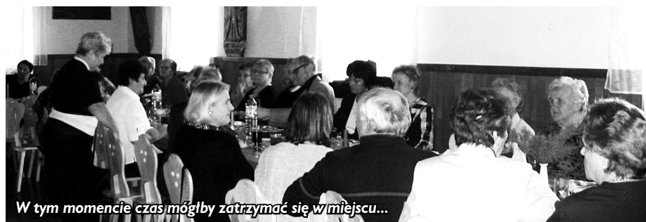
W tym momencie czas mógłby zatrzymać się w miejscu...

Jedna z naszych koleżanek pochwaliła mnie za podobno pyszne śledzie, które przygotowałam na zeszłoroczne ostatki. Pragnę tutaj przyznać, że śledzie owszem zrobiłam, mimo że sama ich nie jadłam. Ale ktoś to musiał zrobić. Myślę, że wszyscy uczestnicy długo będą pamiętać to spotkanie, bo wydaje mi się, że było udane.