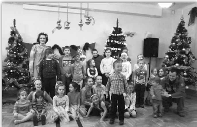
W bolesławskim Dworze...