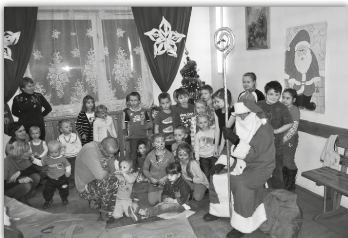
W Domu Wiejskim w Małobądzu...