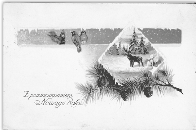
Kartka pocztowa z okazji Nowego Roku wysłana w latach 30. XX wieku.

W dzień Bożego Narodzenia obdarowywano się prezentami (później ten zwyczaj, nazywany kolędą, został przeniesiony na Wigilię i Nowy Rok). Niektórzy sami przymawiali się o podarki. Młodzież wiejska, zaczynając od dworu, chodziła od chaty do chaty i zbierała kolędę. Podobnie czynili organści, klechy, a czasem nawet księża i zakonnicy. Parobcy musieli jednak na kolędę zasłużyć śpiewem, recytowaniem wierszy lub odgrywaniem scenek. W dniu Bożego Narodzenia