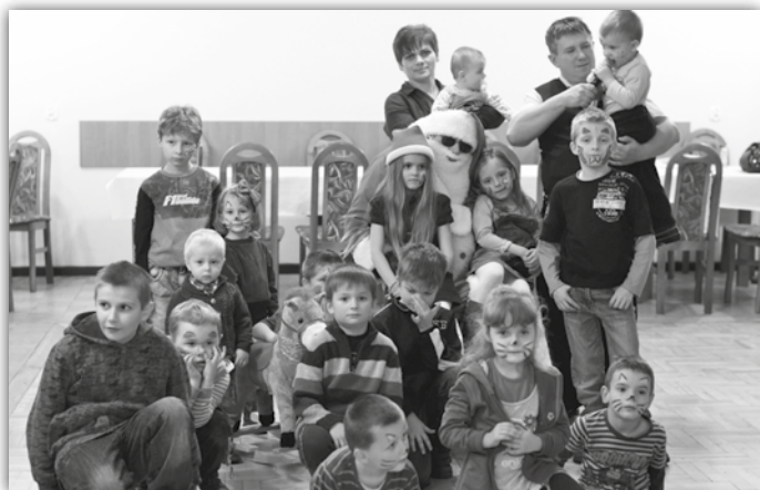
Mikołaj w Domu Wiejskim w Ujkowie Nowym...