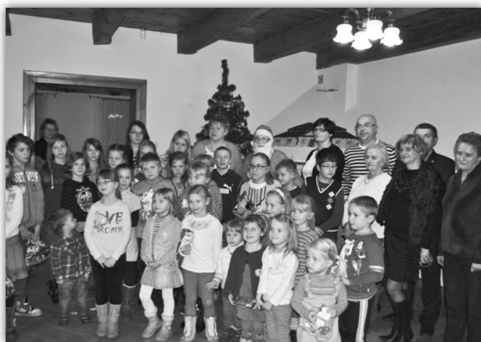
W Staropolskim Dworku w Krzykawce...