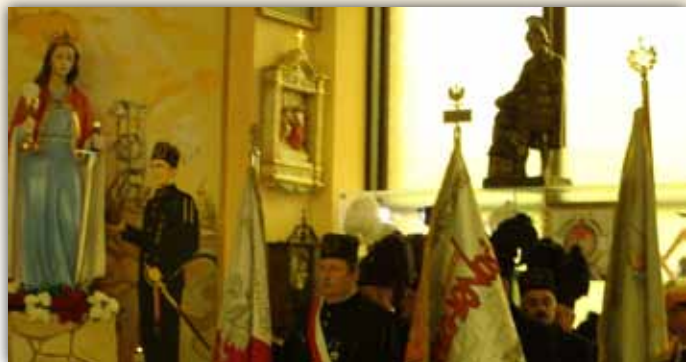
Górnicy przy figurze św. Barbary