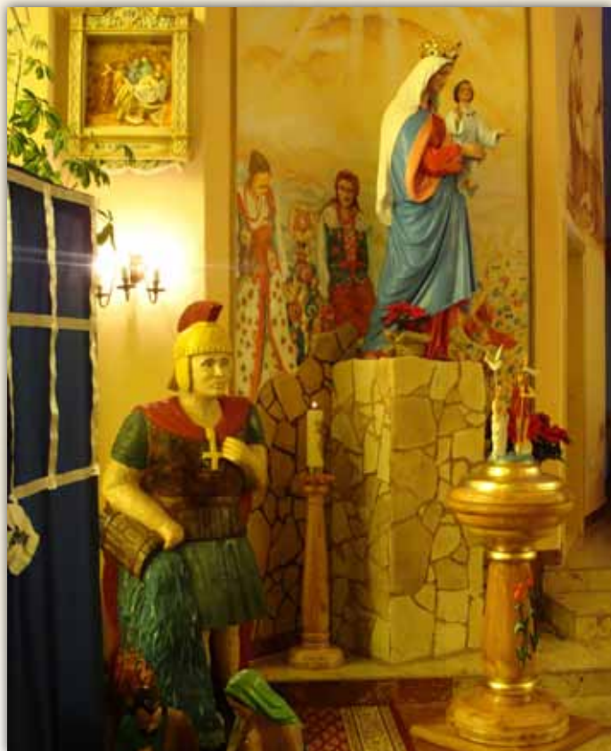
Rzeźba św. Floriana (dłuta Edmunda Pęgla) u stóp najpiękniejszej części świątyni.