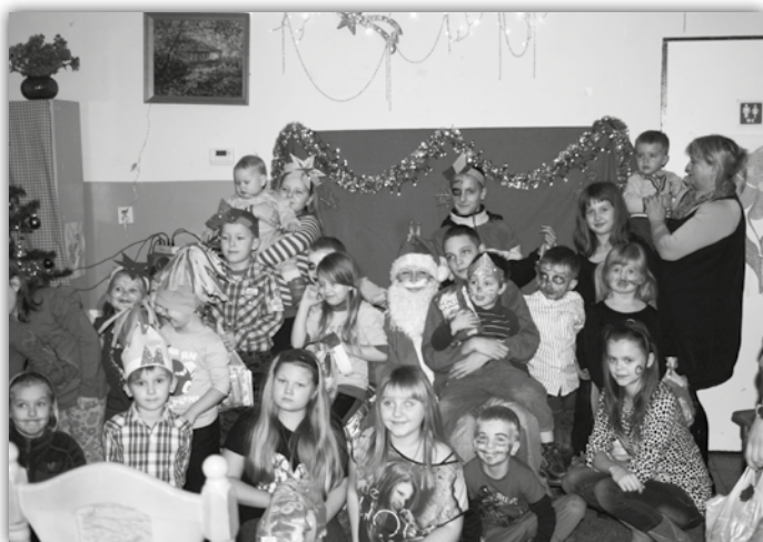
W świetlicy w Hutkach...