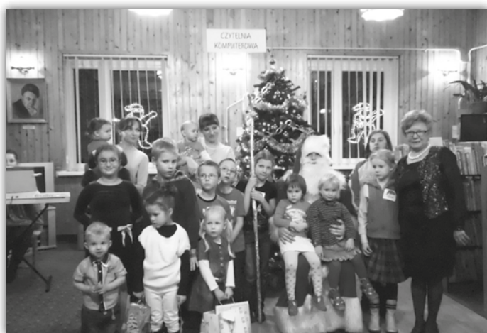
W Gminnej Bibliotece...