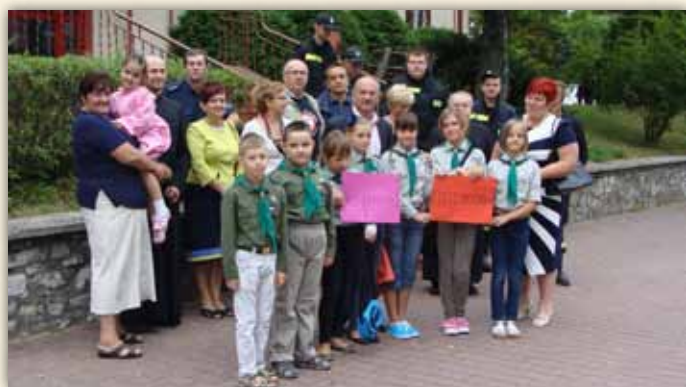
Do akcji włączyli się harcerze i zuchy ze Szkoły Podstawowej w Bolesławiu.