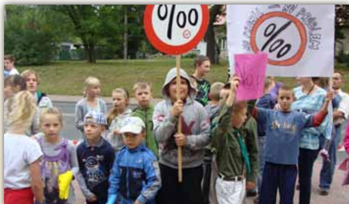
Na Świetlicę "Świetlik"zawsze można liczyć!