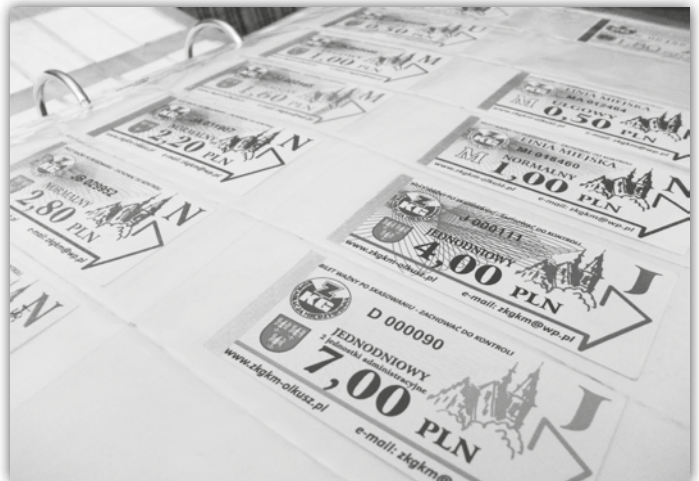
Moja kolekcja biletów z Olkusza

-Nie ma sztywnych zasad, jeśli chodzi o zbieranie biletów. Każdy może zbierać co chce, jak chce i przechowywać zbiór wedle uznania - w segregatorach, pudełkach, gablotkach. Zbierać też można "po swojemu" - tylko bilety ze swojego miasta lub z całego kraju, bądź z całego świata. Wystarczy odłożyć pierwszy skasowany bilecik do kieszeni i już możemy zaczynać kolekcjonowanie. A Olkusz ma jedno z najładniejszych biletów w Polsce, więc Czytelnicy mieliby co zbierać ;-)