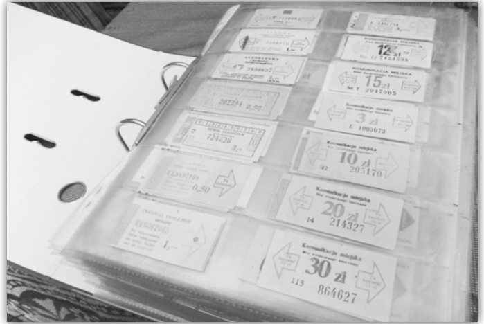
Bilety umieszczone w segregatorze

-Bilety trzymam w specjalnych koszulkach, zaprojektowanych i robionych przez siebie, a te wpinam do zwyczajnych segregatorów.