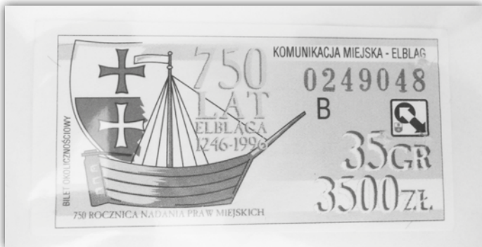
Bilet okolicznościowy wydany z okazji 750-lecia Elbląga

-Bilety zbieram od dziecka, jednak najpierw gromadziłam głównie bilety kolejowe, bo często jeździłam pociągami. Bilety autobusowe także kolekcjonowałam, ale wówczas nie przywiązywałam do nich takiej wagi